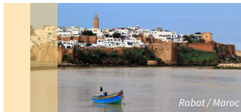
Rabat / Maroc

Immeuble 2 : (dont l'espace recrutement) Angle rue Aguelmane Sidi Ali et avenue Al Amir Fal Ould Omeir 10 000 Rabat- Maroc